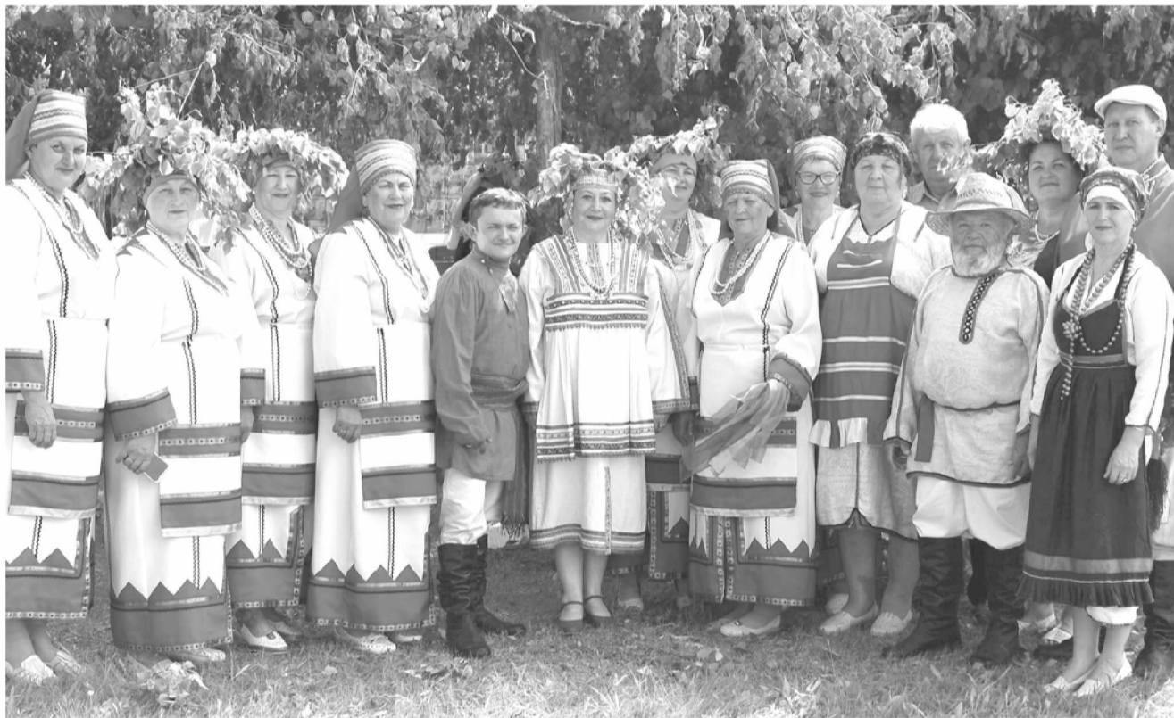
Гордость и слава района, поселения – национальный народный фольклорный мордовский коллектив «Мазы лей» («Красивый родник»)