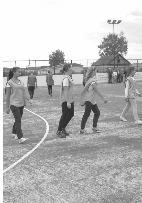
О спорт, ты – мир! На сельской спортивной площадке